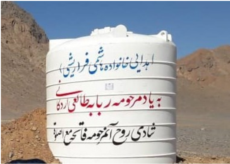
تصویر شماره ۱ - خیرات منبع آب برای آبیاری و شاداب نگه داشتن درختان، آب انبار شهید عباسپور اردکان، ۱۳۹۹