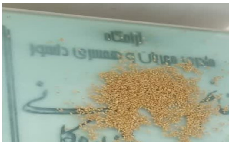
تصویر شماره ۲ - ریختن دانه گندم روی قبر میت برای خیرات، آرامستان شهر اردکان

علاوه بر وقف برای حیوانات، خیرات برای آنها، به خصوص پرندگان نیز به یاد اموات و درگذشتگان در شهر اردکان انجام می‌شود. نگارنده دو نوع خیرات برای پرندگان در آرامستان اردکان مشاهده کرده است. در مورد نخست معمولاً مقداری گندم روی قبر میت می‌ریزند تا پرندگان از آن بخورند که این مورد بیشتر در فصل زمستان که کمتر برای پرندگان دانه و غذا وجود دارد، اتفاق می‌افتد. در مورد بعدی هنگام گذاشتن سنگ قبر برای میت، دو کاسه کوچک آب نیز، به صورت ثابت، بالای سر قبر میت کار می‌گذارند تا بتوان در ایام سال آن را پر آب کرد و پرندگان از آن آب بخورند که این کار نیز در ایام تابستان که شرایط گرما و کم‌آبی برای پرندگان وجود دارد، بیشتر متداول است. این گونه خیرات در تصاویر شماره ۲ و ۳ قابل مشاهده است.