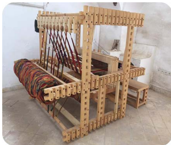
شکل ۳: دستگاه دارایی