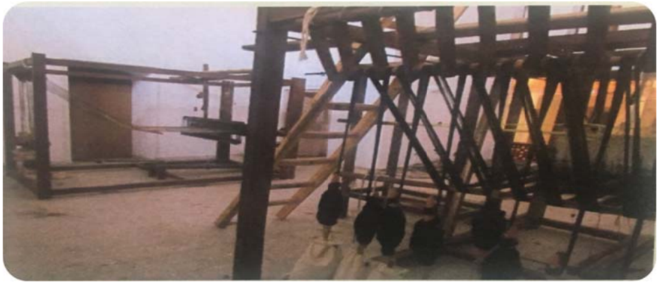
شکل ۴: دستگاه ترمه