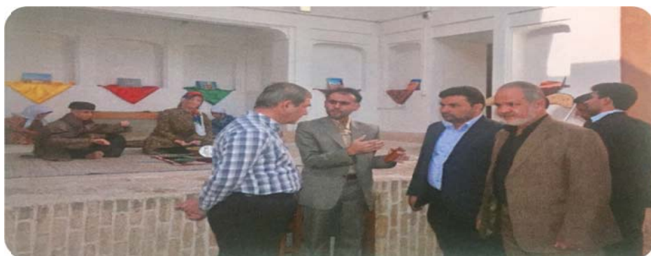
شکل ۲: افتتاح موزه نساجی