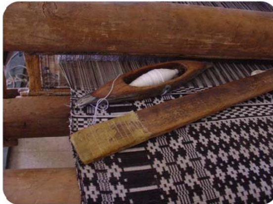
شکل ۱: احیای احرامی بافی